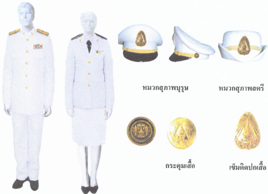
รูปที่ 2 อินทรธนู